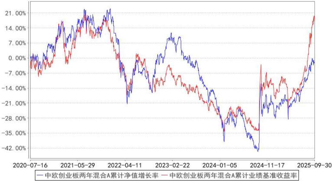
中欧创业板两年混合A累计净值增长率与同期业绩比较基准收益率的历史走势对比图