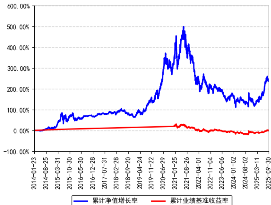
南方医药保健灵活配置混合A累计净值增长率与同期业绩比较基准收益率的历史走势对比图