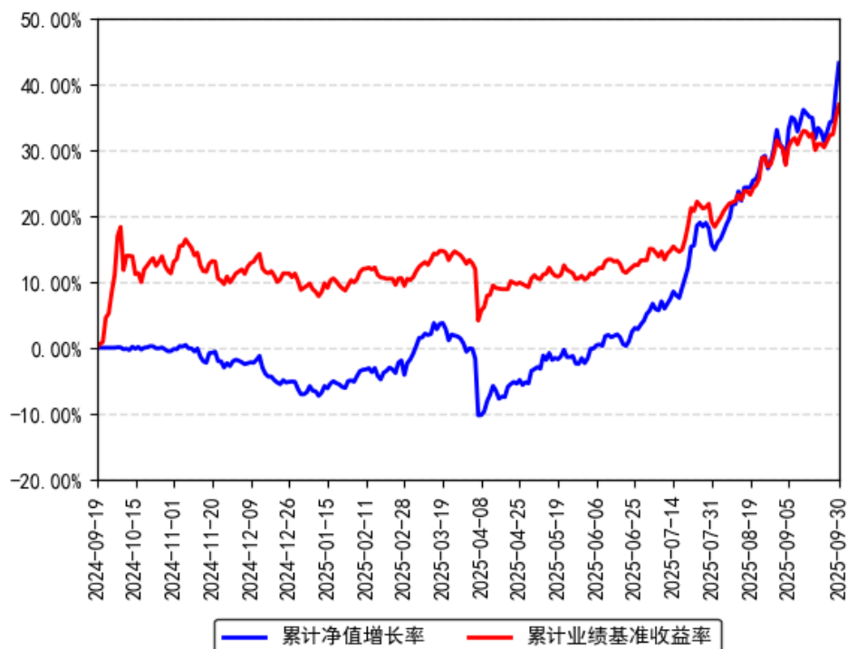
南方周期优选混合发起A累计净值增长率与同期业绩比较基准收益率的历史走势对比图