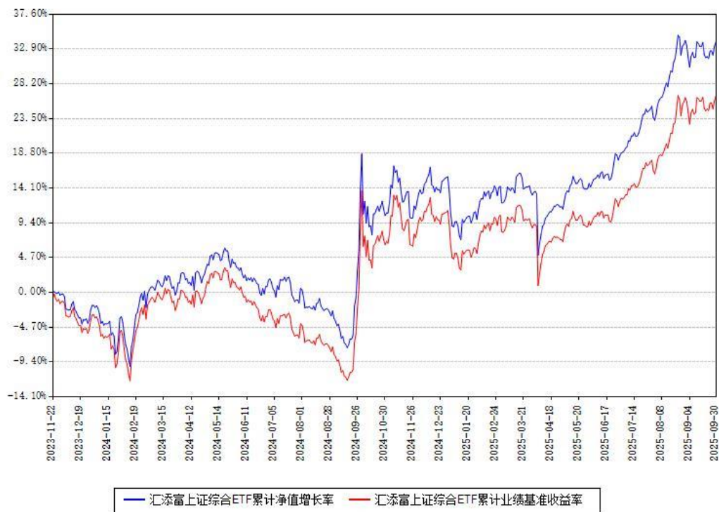
汇添富上证综合ETF累计净值增长率与同期业绩基准收益率对比图