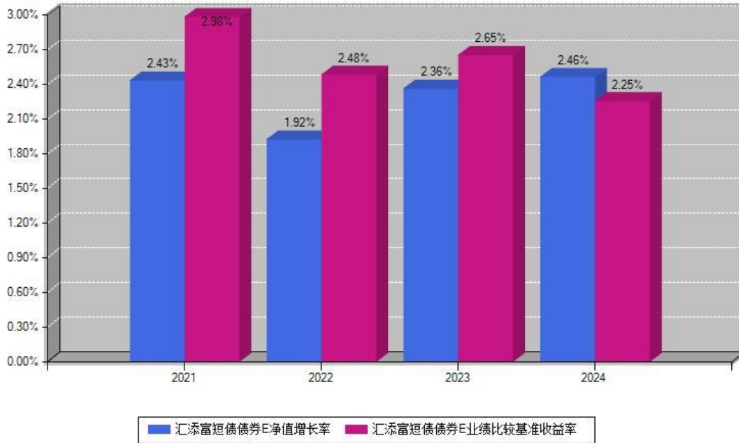
汇添富短债债券E每年净值增长率与同期业绩基准收益率对比图

注：数据截止日期为2024年12月31日，基金的过往业绩不代表未来表现。本《基金合同》生效之日为2018年12月13日，合同生效当年按实际存续期计算，不按整个自然年度进行折算。