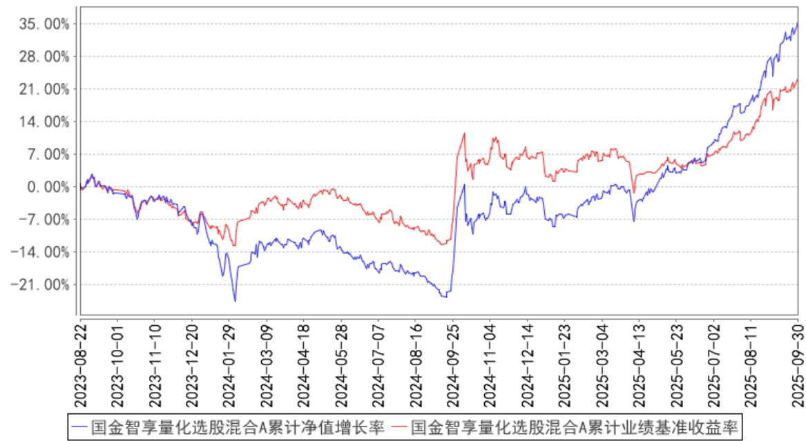
国金智享量化选股混合A累计净值增长率与同期业绩比较基准收益率的历史走势对比图

（二）自基金合同生效以来基金累计净值增长率变动及其与同期业绩比较基准收益率变动的比较