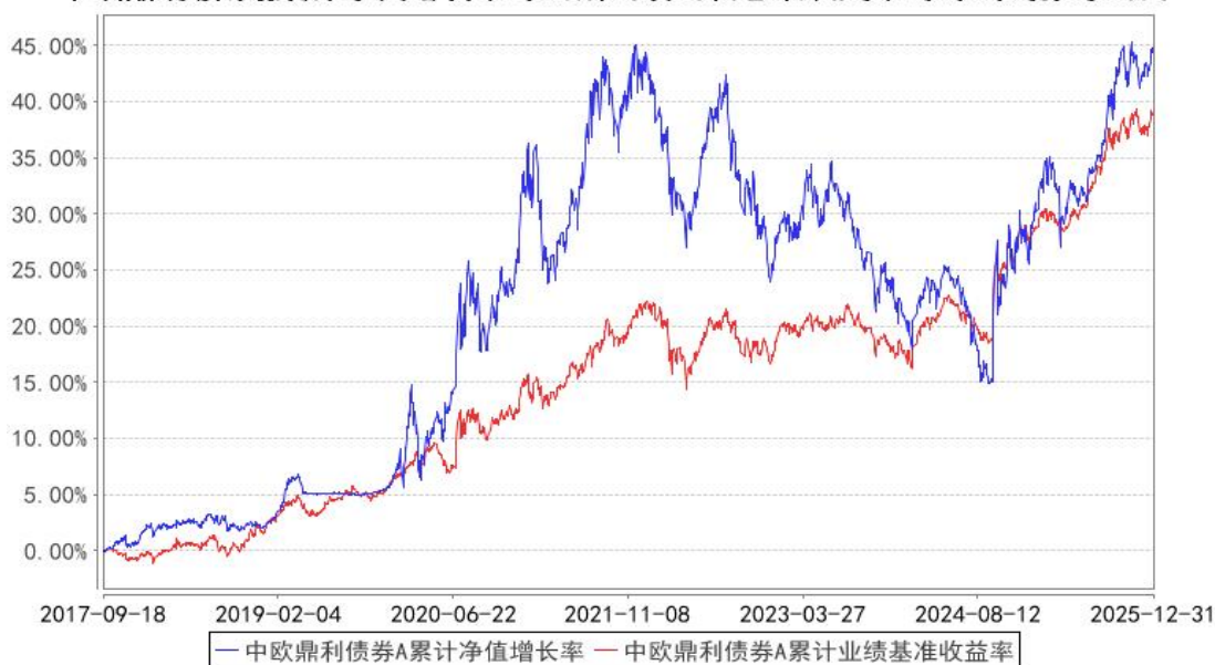
中欧鼎利债券A累计净值增长率与同期业绩比较基准收益率的历史走势对比图

注：本基金转型生效日为 2017 年 9 月 18 日，自 2020 年 6 月 3 日起，本基金业绩比较基准由“中国债券总值指数收益率*90%+沪深 300 指数收益率*10%”变更为“中证 800 指数收益率*15%+中证可转换债券指数*25%+中债综合财富指数收益率*60%”，图示日期为 2017 年 9 月 18 日至 2025 年 12 月 31 日。