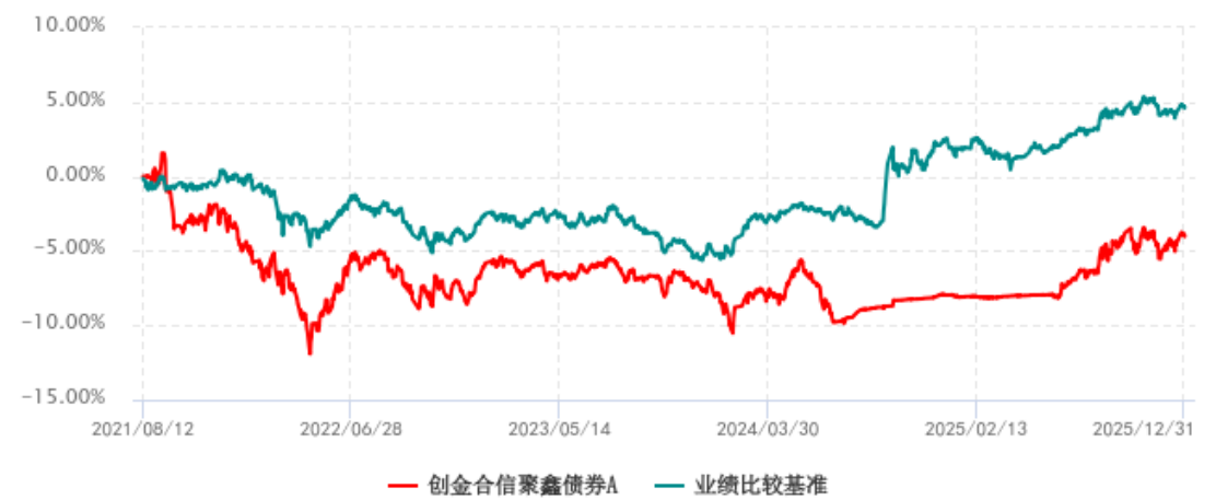
创金合信聚鑫债券A累计净值增长率与业绩比较基准收益率历史走势对比图 (2021年08月12日-2025年12月31日)