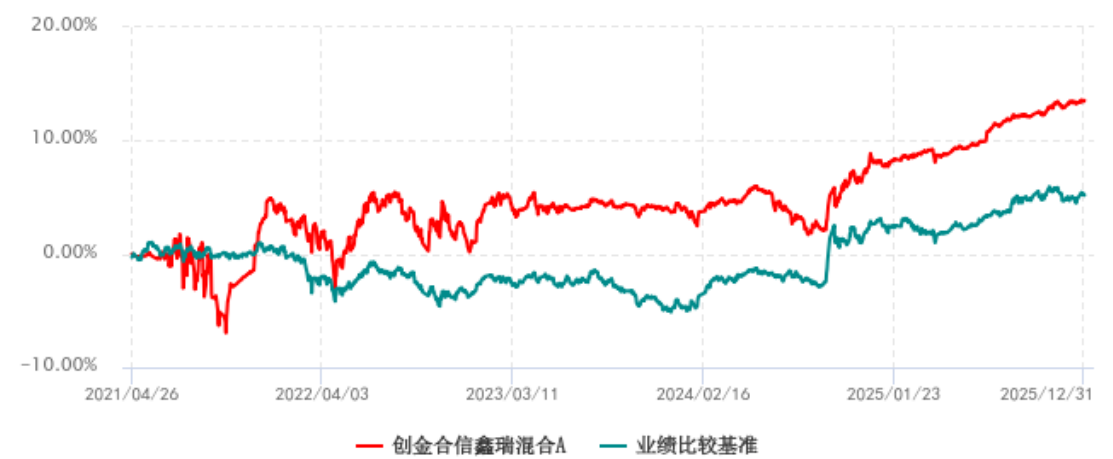
创金合信鑫瑞混合A累计净值增长率与业绩比较基准收益率历史走势对比图 (2021年04月26日-2025年12月31日)