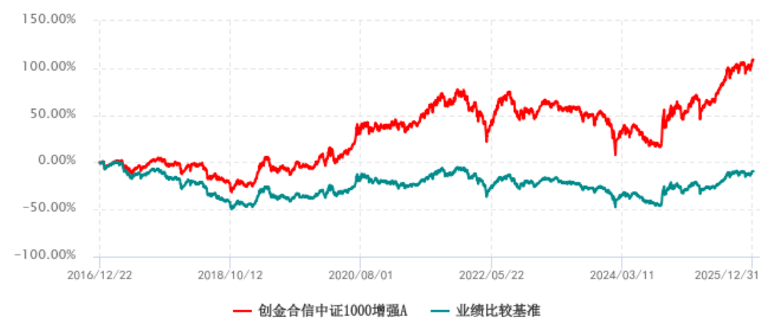
创金合信中证1000增强A累计净值增长率与业绩比较基准收益率历史走势对比图 (2016年12月22日-2025年12月31日)