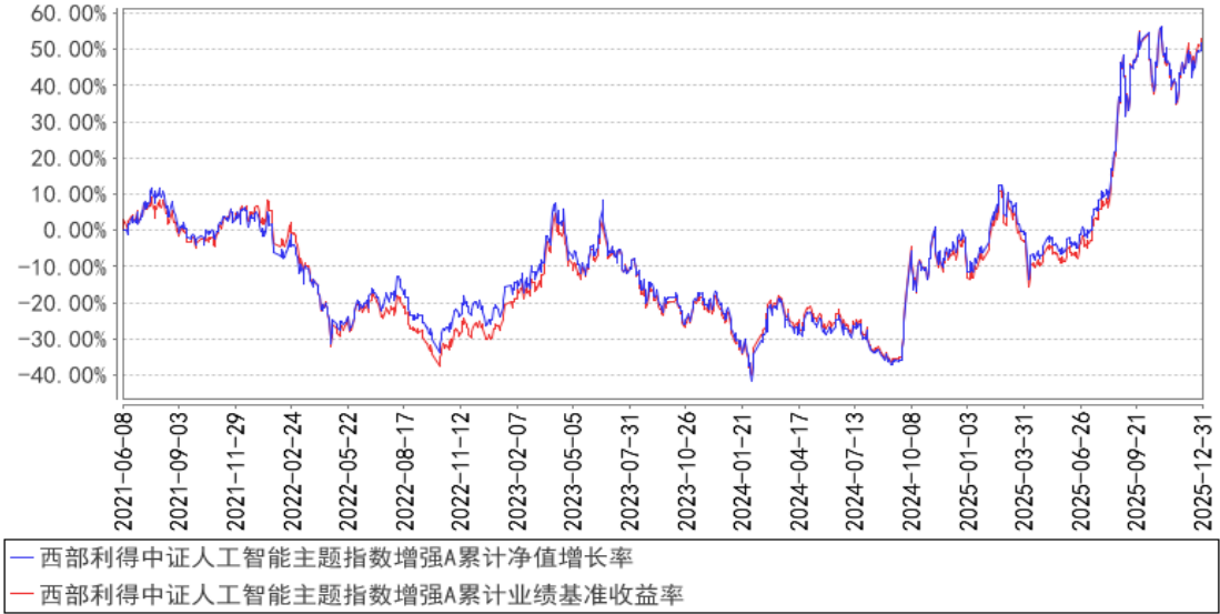
西部利得中证人工智能主题指数增强A累计净值增长率与同期业绩比较基准收益率的历史走势对比图