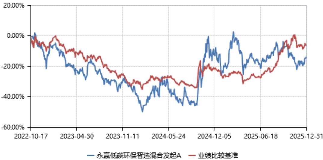
永赢低碳环保智选混合发起A累计净值收益率与业绩比较基准收益率历史走势对比图 (2022年10月17日-2025年12月31日)