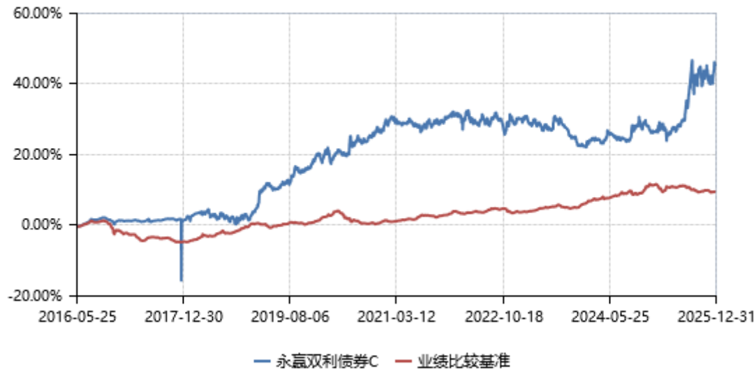
永赢双利债券C累计净值收益率与业绩比较基准收益率历史走势对比图 (2016年05月25日-2025年12月31日)