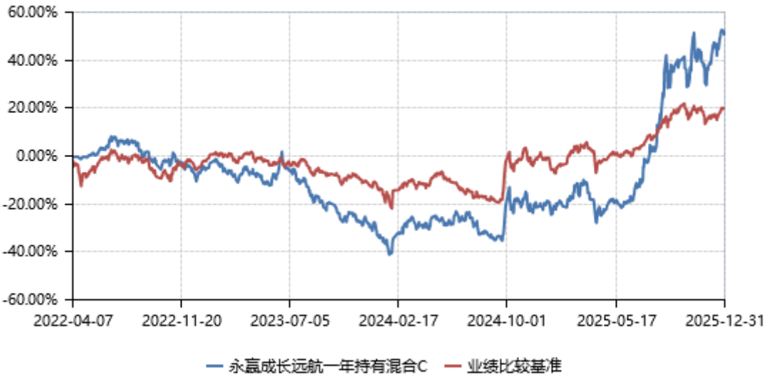
永赢成长远航一年持有混合C累计净值收益率与业绩比较基准收益率历史走势对比图 (2022年04月07日-2025年12月31日)