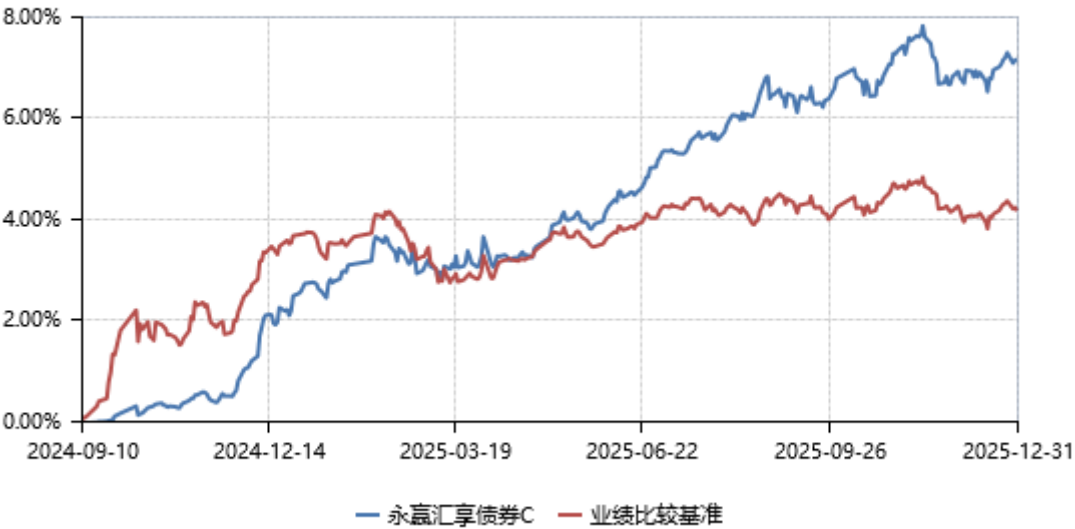
永赢汇享债券C累计净值收益率与业绩比较基准收益率历史走势对比图 (2024年09月10日-2025年12月31日)