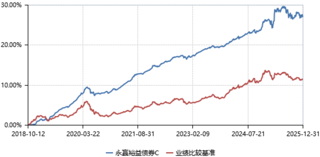
永赢裕益债券C累计净值收益率与业绩比较基准收益率历史走势对比图 (2018年10月12日-2025年12月31日)