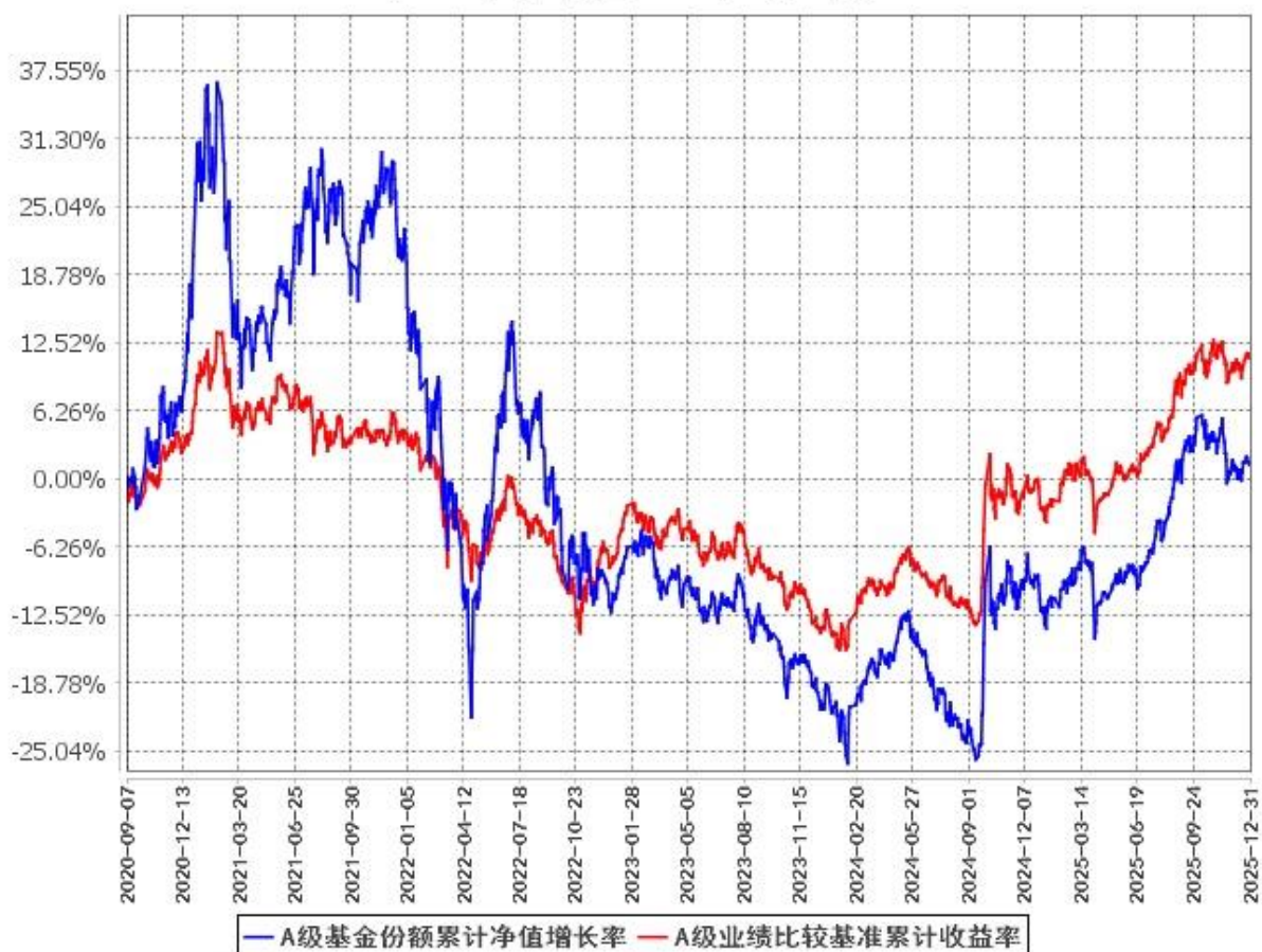
A级基金份额累计净值增长率与同期业绩比较基准收益率的历史走势对比图 (2020年9月7日至2025年12月31日)