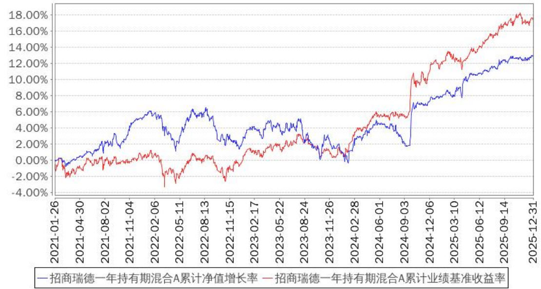
招商瑞德一年持有期混合A累计净值增长率与同期业绩比较基准收益率的历史走势对比图