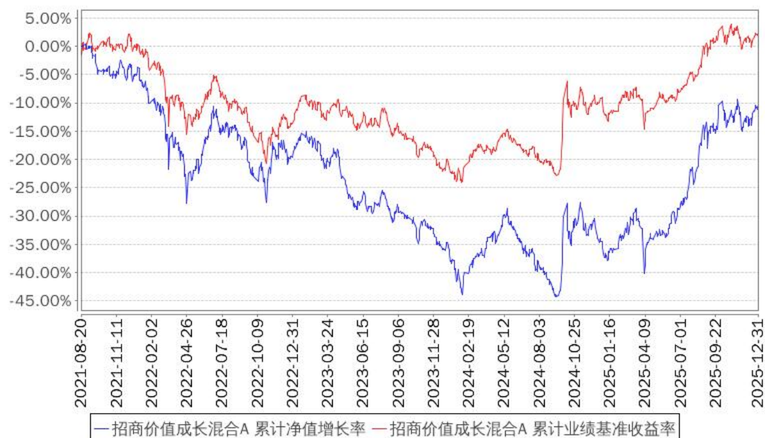
招商价值成长混合A 累计净值增长率与同期业绩比较基准收益率的历史走势对比图