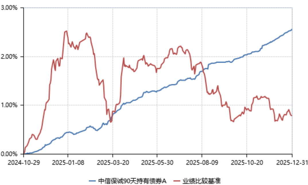
中信保诚 90 天持有债券 A