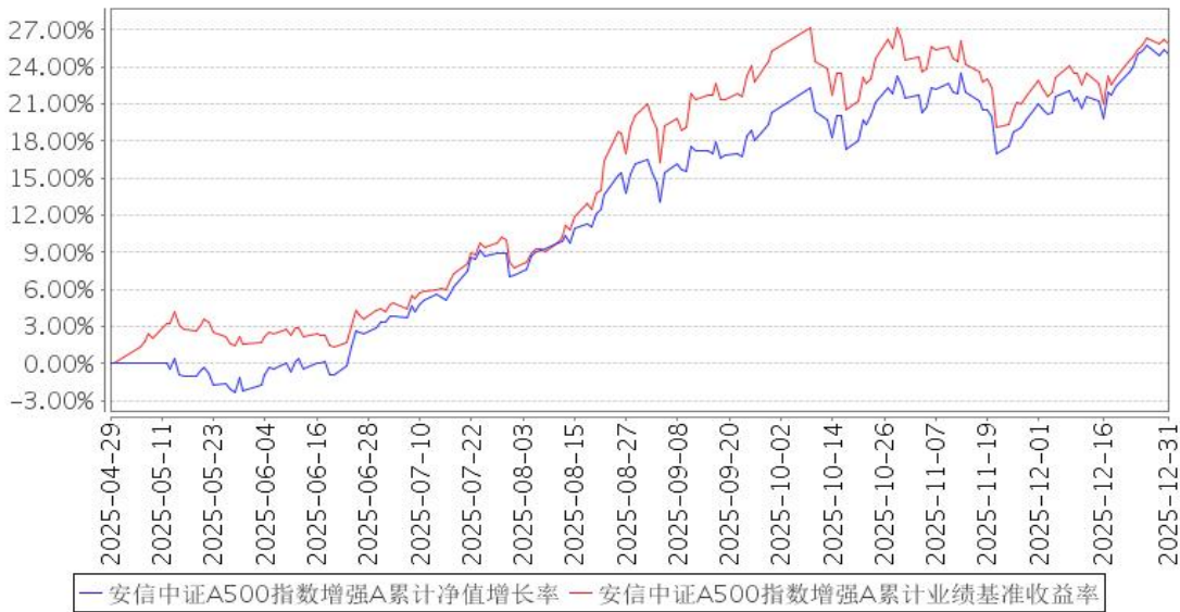
安信中证A500指数增强A累计净值增长率与同期业绩比较基准收益率的历史走势对比图