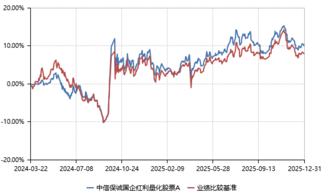
中信保诚国企红利量化股票 A