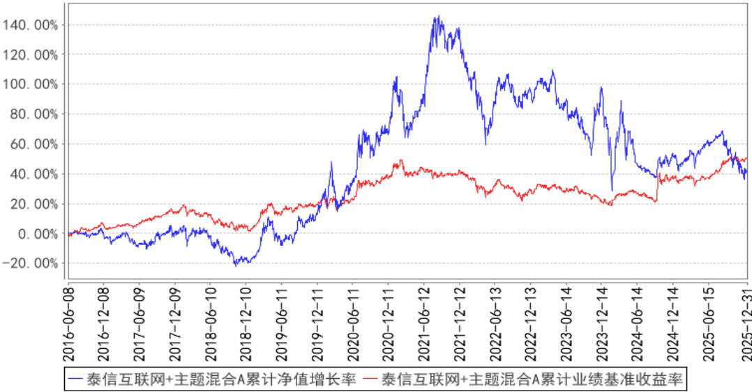
泰信互联网+主题混合A累计净值增长率与同期业绩比较基准收益率的历史走势对比图

注：本基金业绩比较基准为：沪深 300 指数收益率×50%+上证国债指数收益率×50%