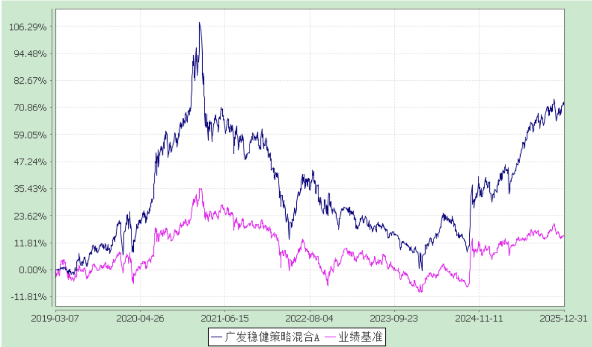
广发稳健策略混合型证券投资基金 累计净值增长率与业绩比较基准收益率的历史走势对比图 (2019 年 3 月 7 日至 2025 年 12 月 31 日)