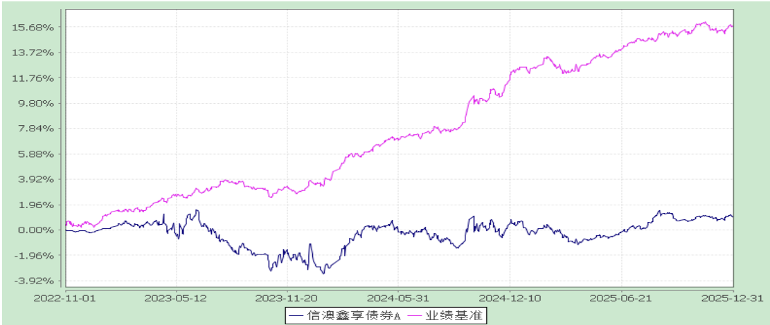
信澳鑫享债券 C 累计净值增长率与业绩比较基准收益率的历史走势对比图 (2022 年 11 月 1 日至 2025 年 12 月 31 日)