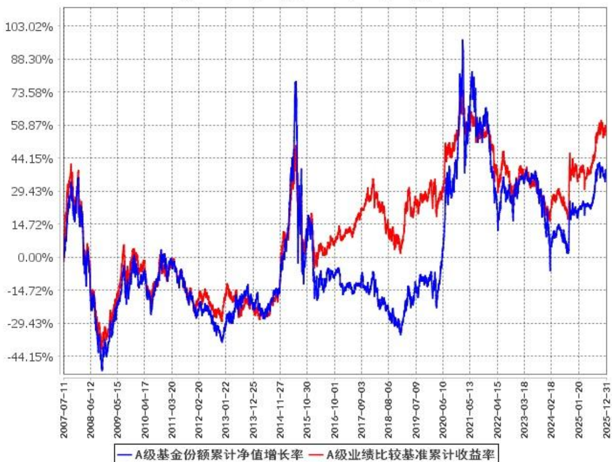
A级基金份额累计净值增长率与同期业绩比较基准收益率的历史走势对比图 (2007年7月11日至2025年12月31日)