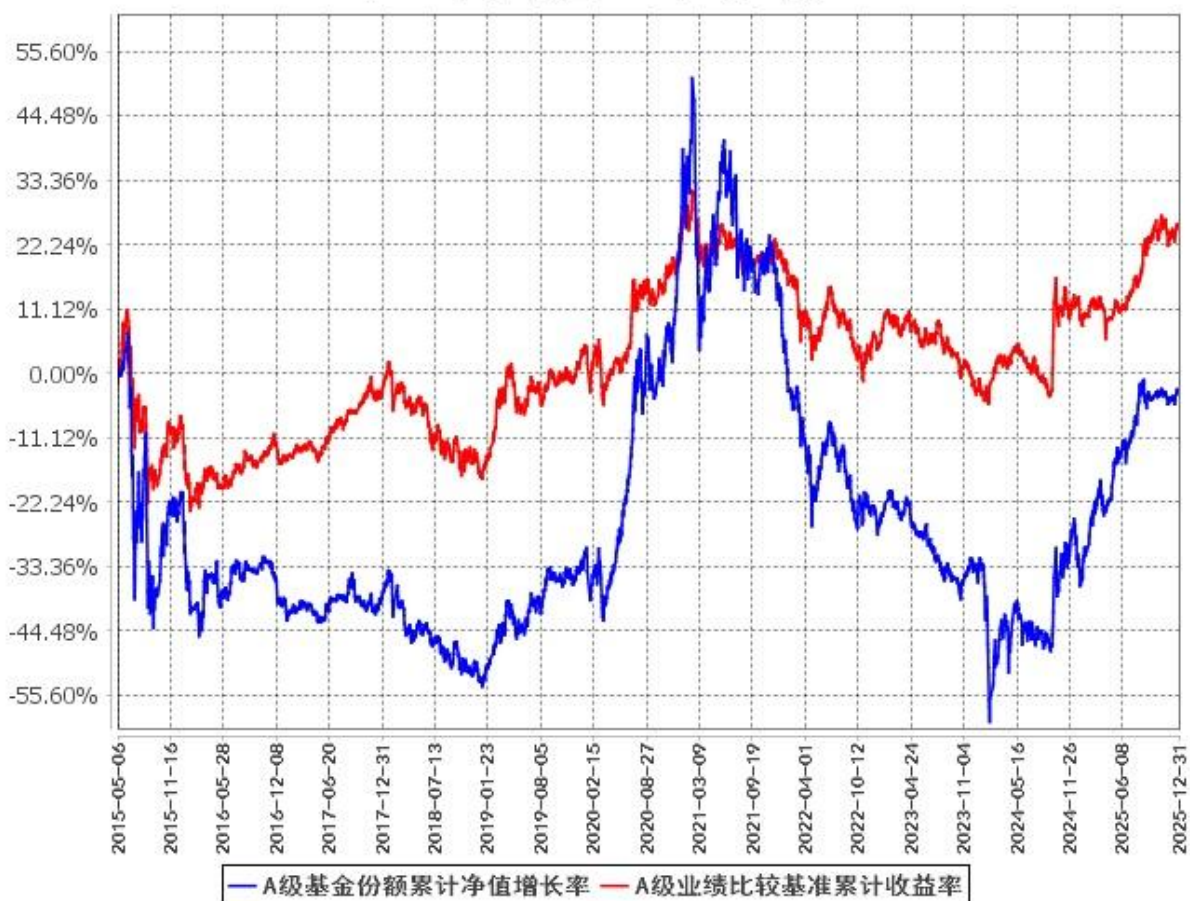
A级基金份额累计净值增长率与同期业绩比较基准收益率的历史走势对比图 (2015年5月6日至2025年12月31日)