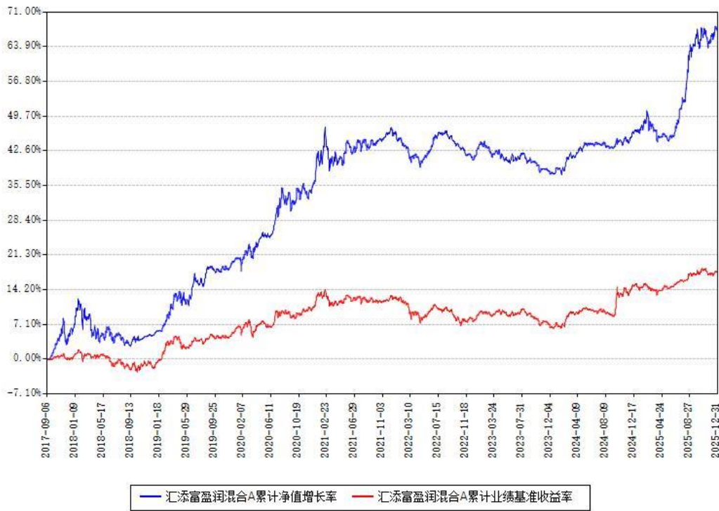
汇添富盈润混合A累计净值增长率与同期业绩基准收益率对比图