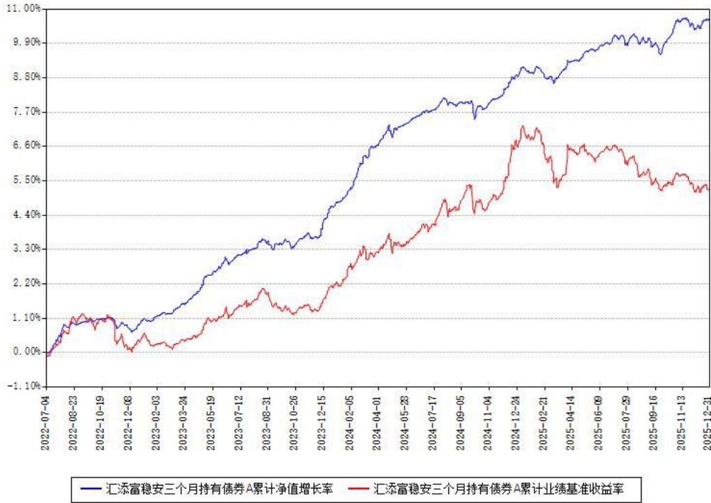
汇添富稳安三个月持有债券A累计净值增长率与同期业绩基准收益率对比图