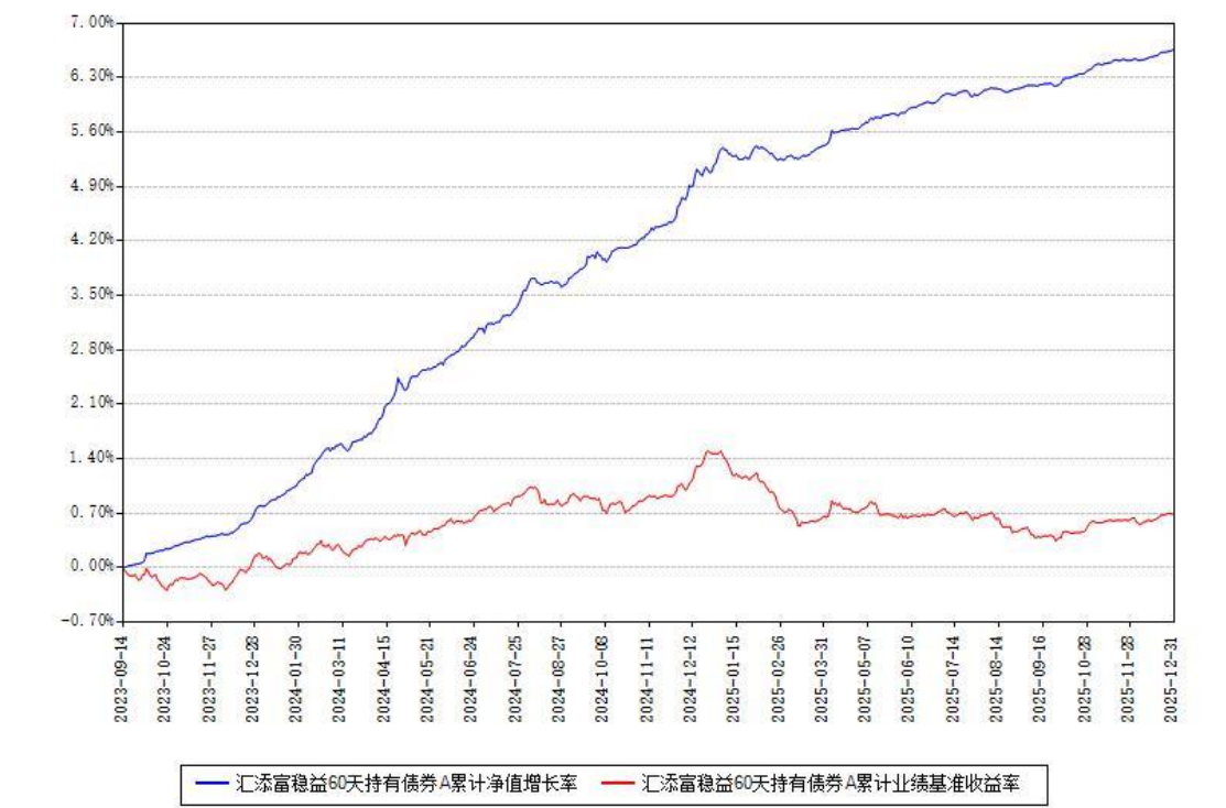
汇添富稳益60天持有债券A累计净值增长率与同期业绩比较基准收益率对比图