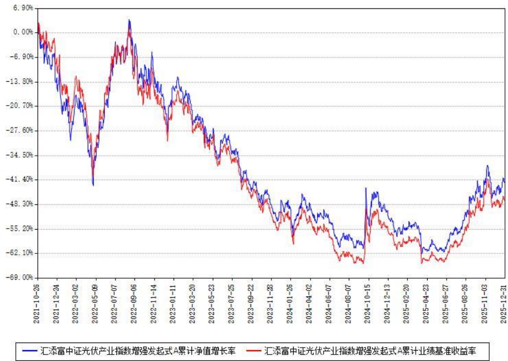
汇添富中证光伏产业指数增强发起式A累计净值增长率与同期业绩基准收益率对比图