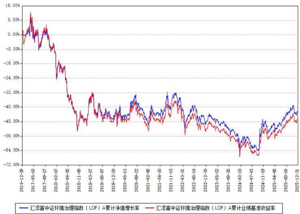
汇添富中证环境治理指数（LOF）A累计净值增长率与同期业绩基准收益率对比图