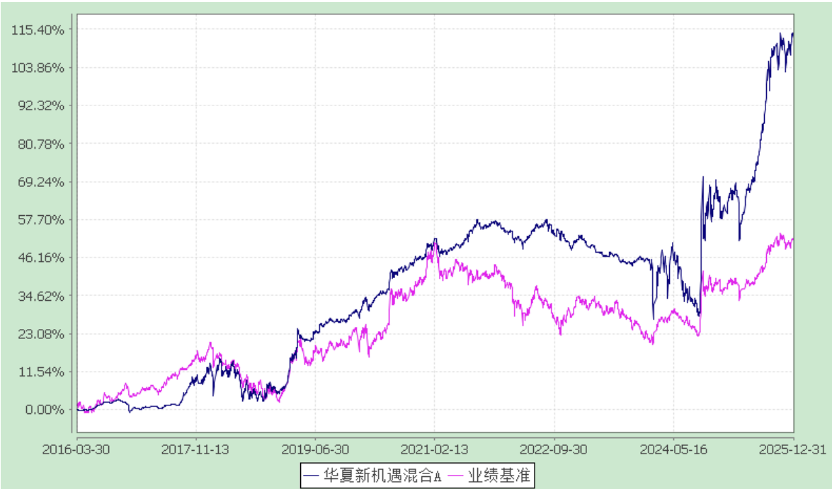
华夏新机遇灵活配置混合型证券投资基金 累计净值增长率与业绩比较基准收益率的历史走势对比图 (2016 年 3 月 30 日至 2025 年 12 月 31 日)