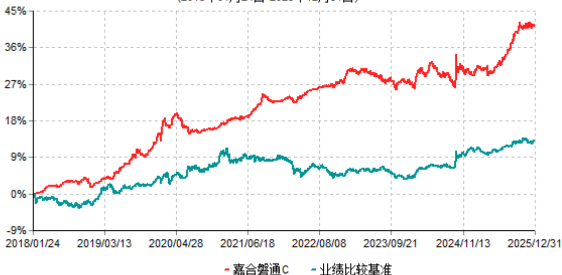
嘉合磐通C累计净值增长率与业绩比较基准收益率历史走势对比图 (2018年01月24日-2025年12月31日)