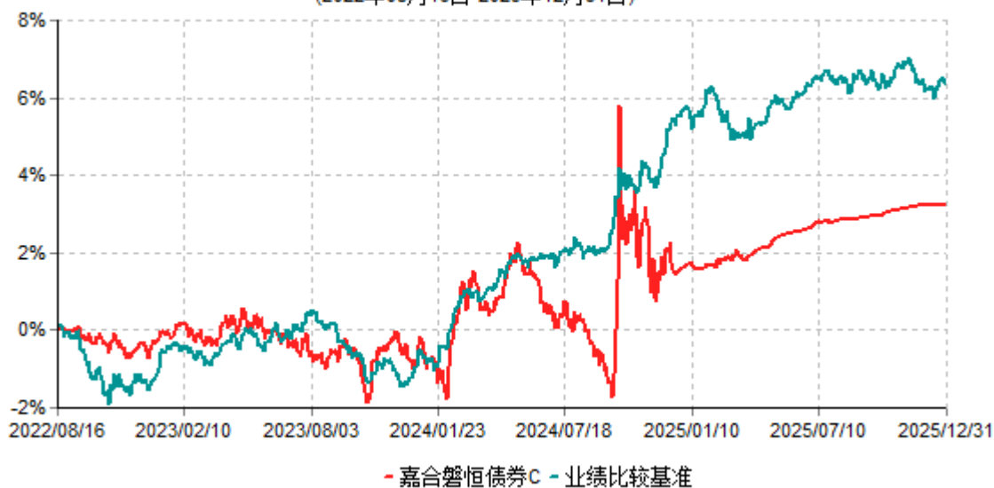
嘉合磐恒债券C累计净值增长率与业绩比较基准收益率历史走势对比图 (2022年08月16日-2025年12月31日)