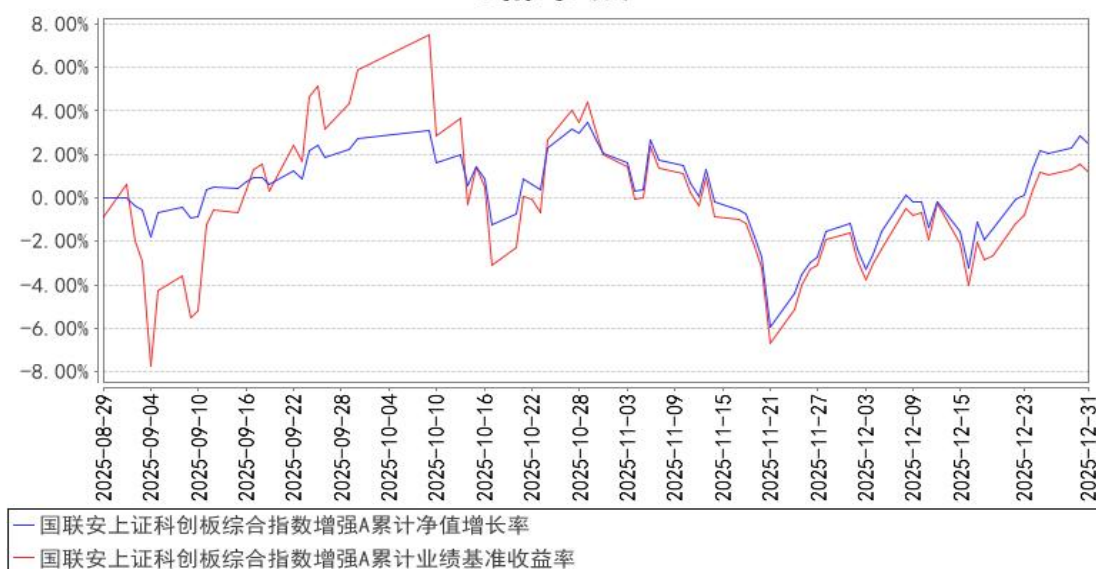
国联安上证科创板综合指数增强A累计净值增长率与同期业绩比较基准收益率的历史走势对比图