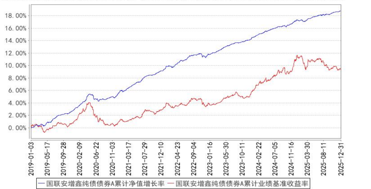
国联安增鑫纯债债券A累计净值增长率与同期业绩比较基准收益率的历史走势对比图

注：1、本基金业绩比较基准为中债综合指数收益率； 2、本基金基金合同于 2019 年 1 月 3 日生效； 3、本基金建仓期为自基金合同生效之日起的 6 个月，建仓期结束时各项资产配置符合合同约定。