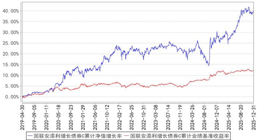
国联安添利增长债券C累计净值增长率与同期业绩比较基准收益率的历史走势对比图

注：1、本基金的业绩比较基准为： 中债综合指数收益率×90%+沪深 300 指数收益率×10%； 2、本基金基金合同于 2019 年 4 月 30 日生效； 3、本基金建仓期为自基金合同生效之日起的 6 个月，建仓期结束时各项资产配置符合合同约定。