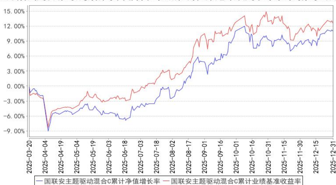
国联安主题驱动混合C累计净值增长率与同期业绩比较基准收益率的历史走势对比图

注：1、国联安主题驱动混合型证券投资基金于 2025 年 3 月 19 日起增加收取销售服务费的 C 类基金份额，并对本基金基金合同及托管协议作相应修改，原有的基金份额在增加收取销售服务费的 C 类基金份额后，全部转换为国联安主题驱动混合型证券投资基金 A 类份额；