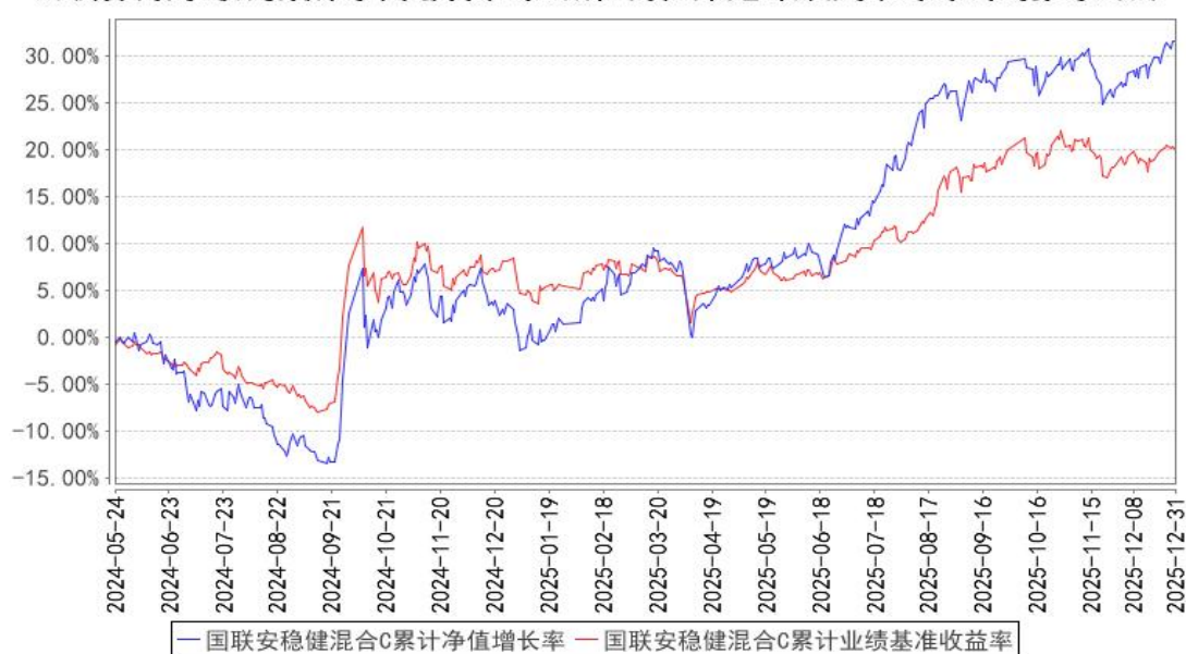
国联安德盛稳健混合C累计净值增长率与同期业绩比较基准收益率的历史走势对比图

注：1、国联安德盛稳健证券投资基金于 2024 年 5 月 17 日起增加收取销售服务费的 C 类基金份额，并对本基金基金合同及托管协议作相应修改，原有的基金份额在增加收取销售服务费的 C 类基金份额后，全部转换为国联安德盛稳健证券投资基金 A 类份额；