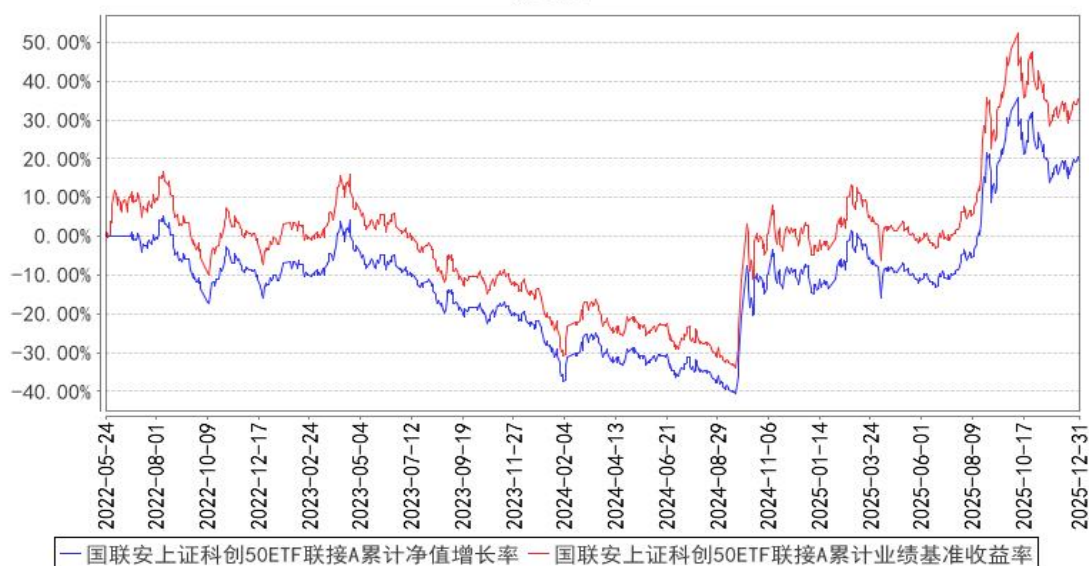
国联安上证科创50ETF联接A累计净值增长率与同期业绩比较基准收益率的历史走势对比图