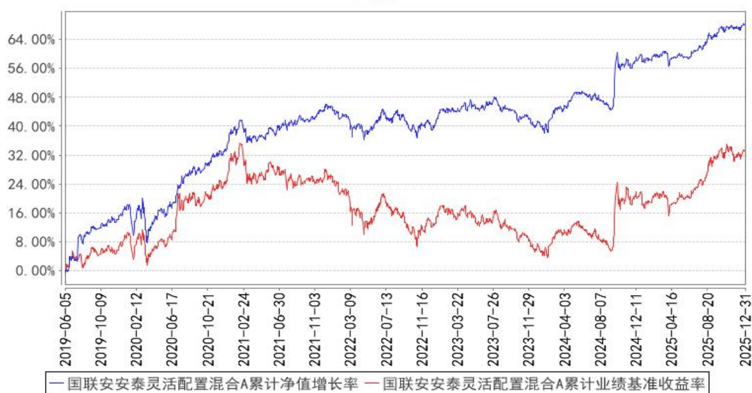
国联安泰灵活配置混合A累计净值增长率与同期业绩比较基准收益率的历史走势对比图

注：1、国联安泰灵活配置混合型证券投资基金于 2025 年 7 月 17 日起增加收取销售服务费的 C 类基金份额，并对本基金基金合同及托管协议作相应修改，原有的基金份额在增加收取销售服务费的 C 类基金份额后，全部自动转换为国联安泰灵活配置混合型证券投资基金 A 类份额；