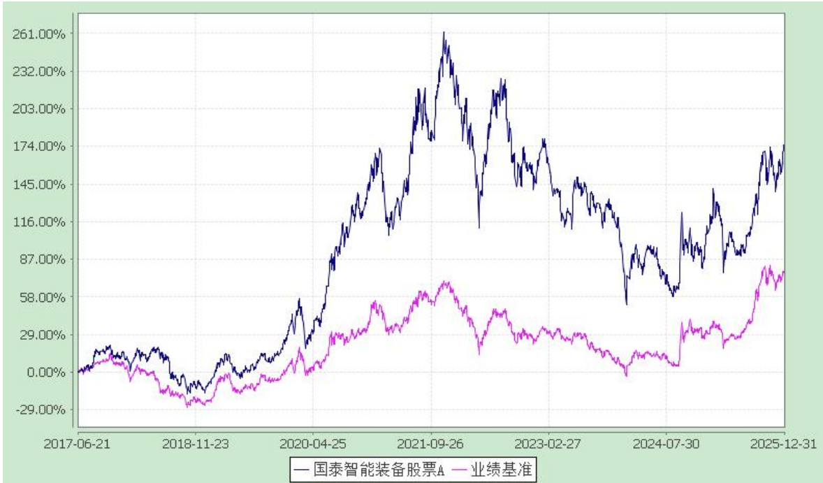
国泰智能装备股票型证券投资基金 累计净值增长率与业绩比较基准收益率的历史走势对比图 (2017 年 6 月 21 日至 2025 年 12 月 31 日)

注：本基金的合同生效日为 2017 年 6 月 21 日，本基金的建仓期为 6 个月，在建仓期结束时，各项资产配置比例符合合同约定。