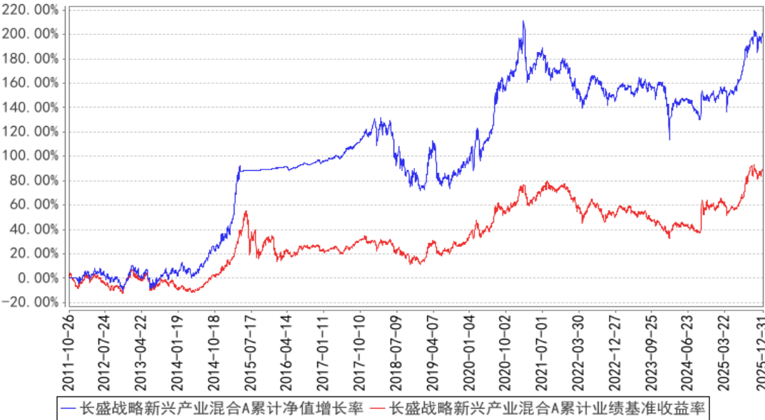
长盛战略新兴产业混合A累计净值增长率与同期业绩比较基准收益率的历史走势对比图