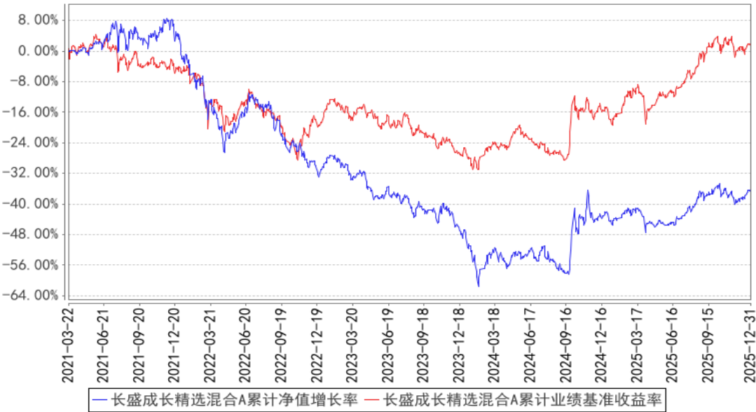
长盛成长精选混合A累计净值增长率与同期业绩比较基准收益率的历史走势对比图