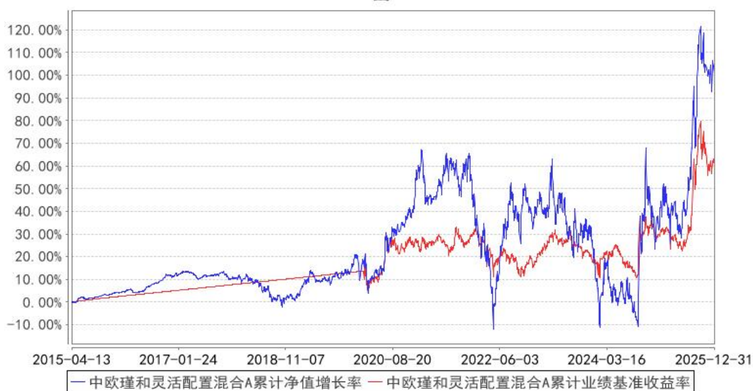
中欧瑾和灵活配置混合A累计净值增长率与同期业绩比较基准收益率的历史走势对比图

注：2025 年 4 月 17 日起组合业绩比较基准由中证 800 行业中性低波动指数收益率*80%+中证短债指数收益率*20%变更为上证科创板 50 成份指数收益率*80%+银行活期存款利率(税后)*20%。