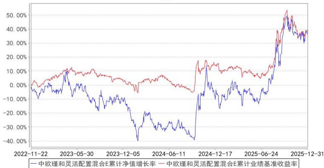
中欧瑾和灵活配置混合E累计净值增长率与同期业绩比较基准收益率的历史走势对比图

注：本基金于 2022 年 11 月 21 日新增 E 类份额，图示日期为 2022 年 11 月 22 日至 2025 年 12 月 31 日。