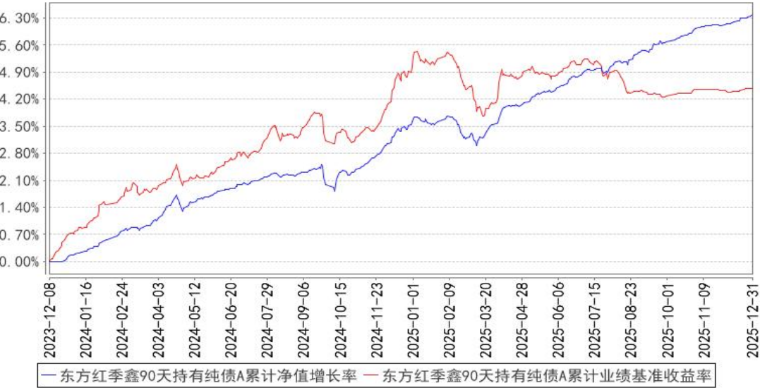
东方红季鑫90天持有纯债A累计净值增长率与同期业绩比较基准收益率的历史走势对比图