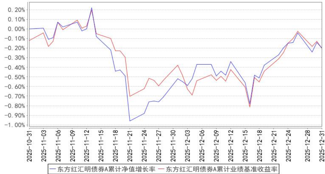
东方红汇明债券A累计净值增长率与同期业绩比较基准收益率的历史走势对比图