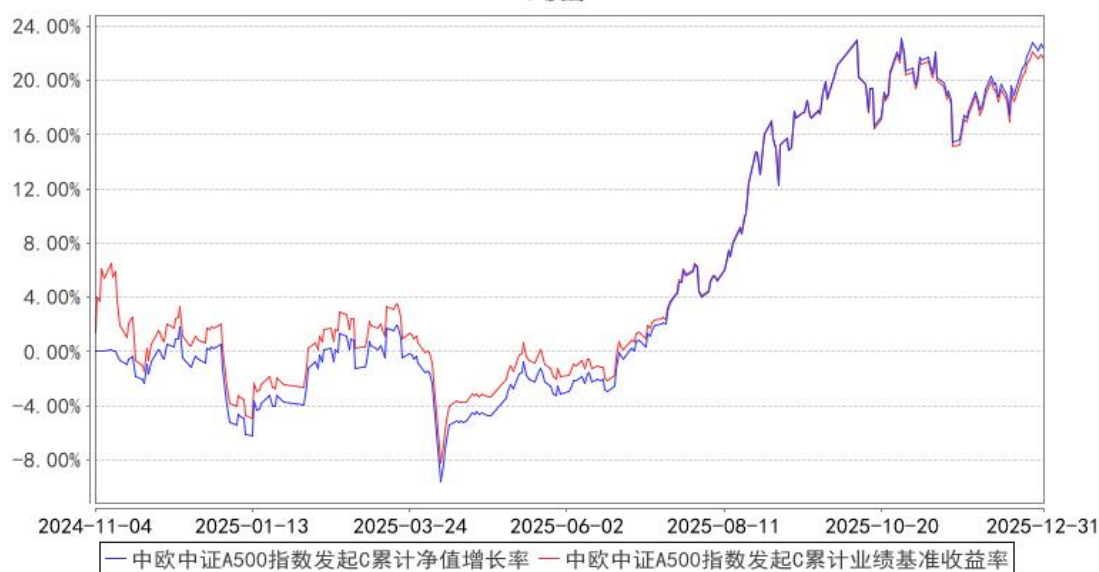
中欧中证A500指数发起C累计净值增长率与同期业绩比较基准收益率的历史走势对比图

注：本基金基金合同生效日期为 2024 年 11 月 4 日，按基金合同的规定，本基金自基金合同生效起六个月为建仓期，建仓期结束时各项资产配置比例已经符合基金合同约定。