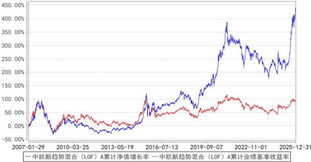
中欧新趋势混合（LOF）A 累计净值增长率与同期业绩比较基准收益率的历史走势对比图