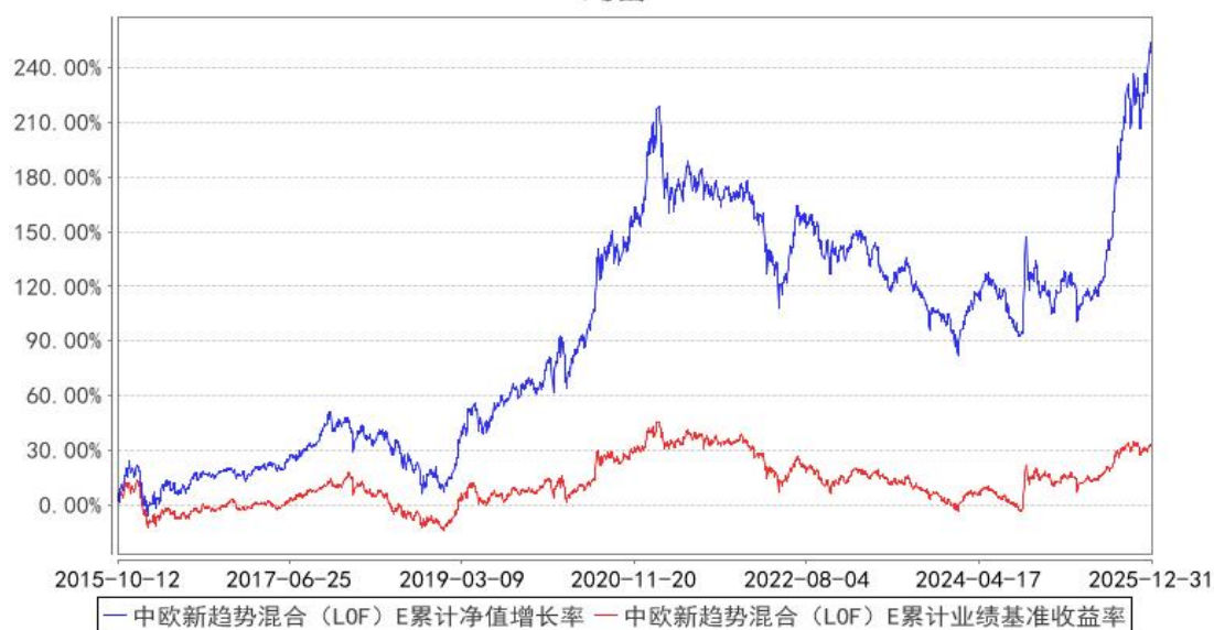
中欧新趋势混合（LOF）E 累计净值增长率与同期业绩比较基准收益率的历史走势对比图

注：本基金于 2015 年 10 月 8 日新增 E 类份额，图示日期为 2015 年 10 月 12 日至 2025 年 12 月 31 日。